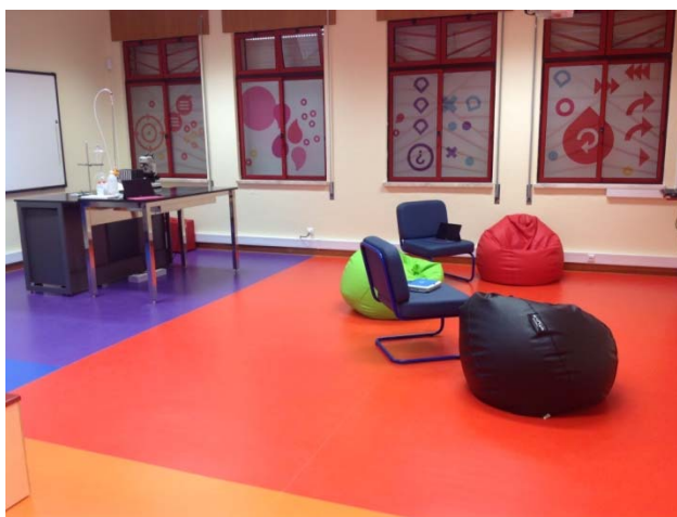
Figura 1 - Sala de Aula do Futuro

A Sala de Aula do Futuro ( SAFuturo ) é um espaço modular, equipado com os mais modernos equipamentos de apoio ao ensino, e utilizado quer para a formação dos professores, quer para a utilização em experiências pedagógicas, envolvendo alunos. Serve ainda como mostra para os equipamentos disponibilizados pelos diversos fornecedores de equipamentos, podendo ser utilizados e testados em contexto pelos diversos intervenientes do processo de ensino e de aprendizagem.